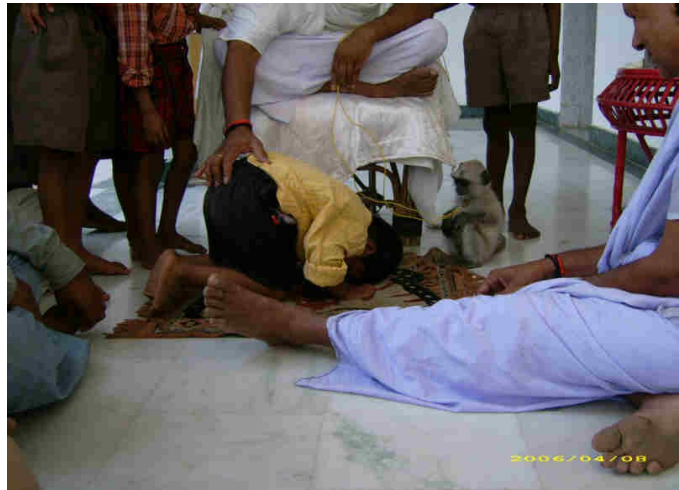
SATYAM SI INCHINA DI FRONTE A QUESTO NUOVO AMICO IN SEGNO DI BENVENUTO

La simbologia della scimmia in India è particolarmente legata alla figura di Hanuman . Hanuman , considerato appunto il dio scimmia è largamente adorato in tutta l'India ed è una delle divinità più amate in quanto incarnazione delle più nobili virtù.