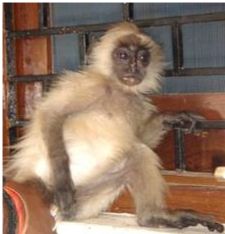
IL CUCCILO DI LANGUR