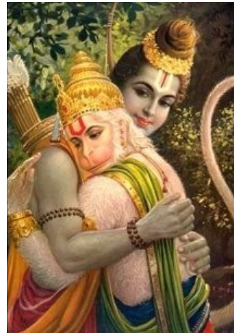
HANUMAN E RAMA