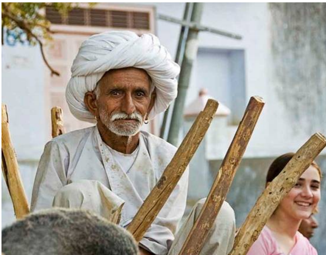
Il nostro amico accompagnatore ed autista del carro