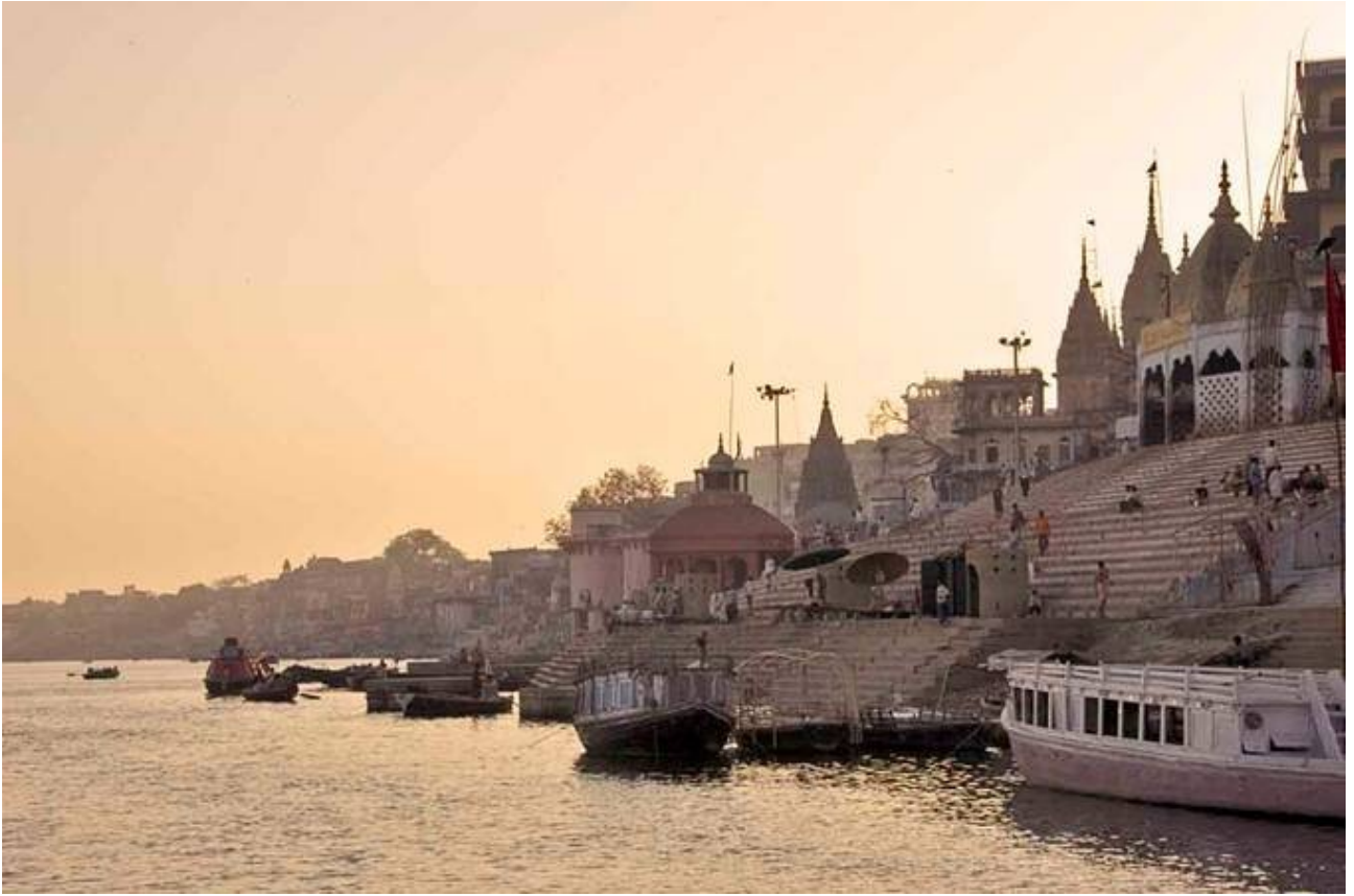
E dopo due settimane il ritorno all'amata Varanasi.....