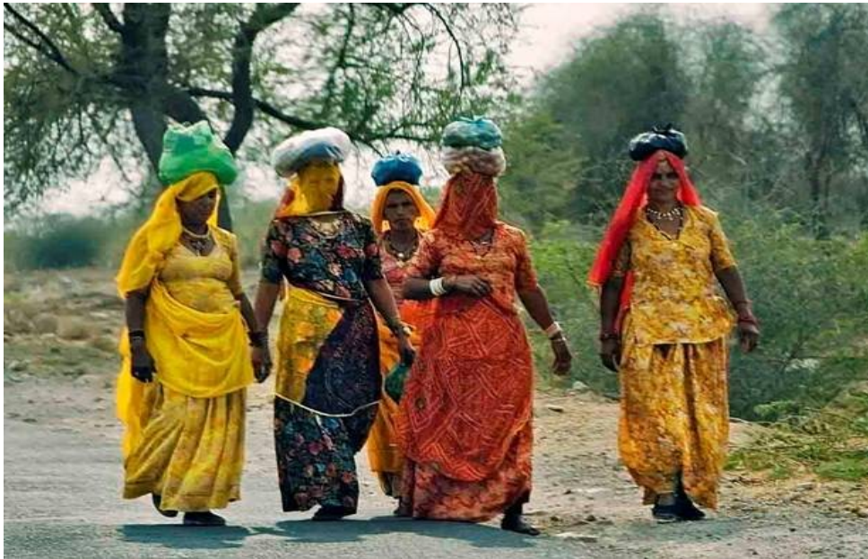
Donne rajasthane in cammino tra Jodhpur e Jaisalmer