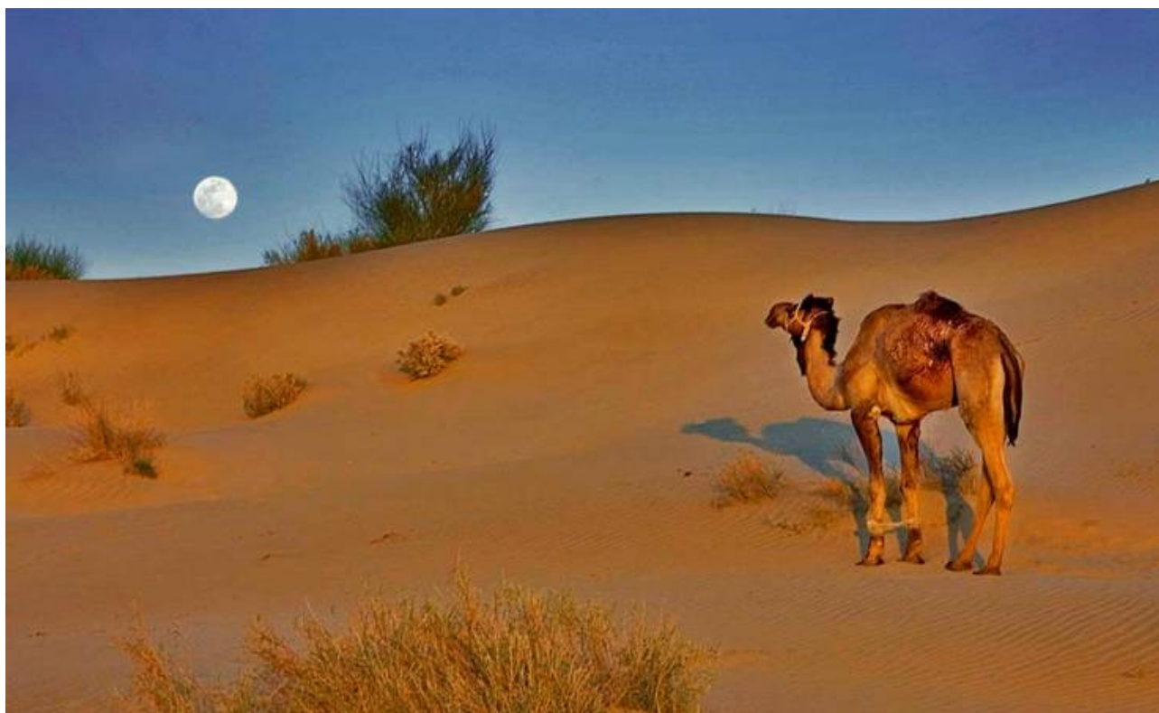
Il nostro accampamento notturno con la luna piena che si leva nel cielo e l'ombra del sole al tramonto