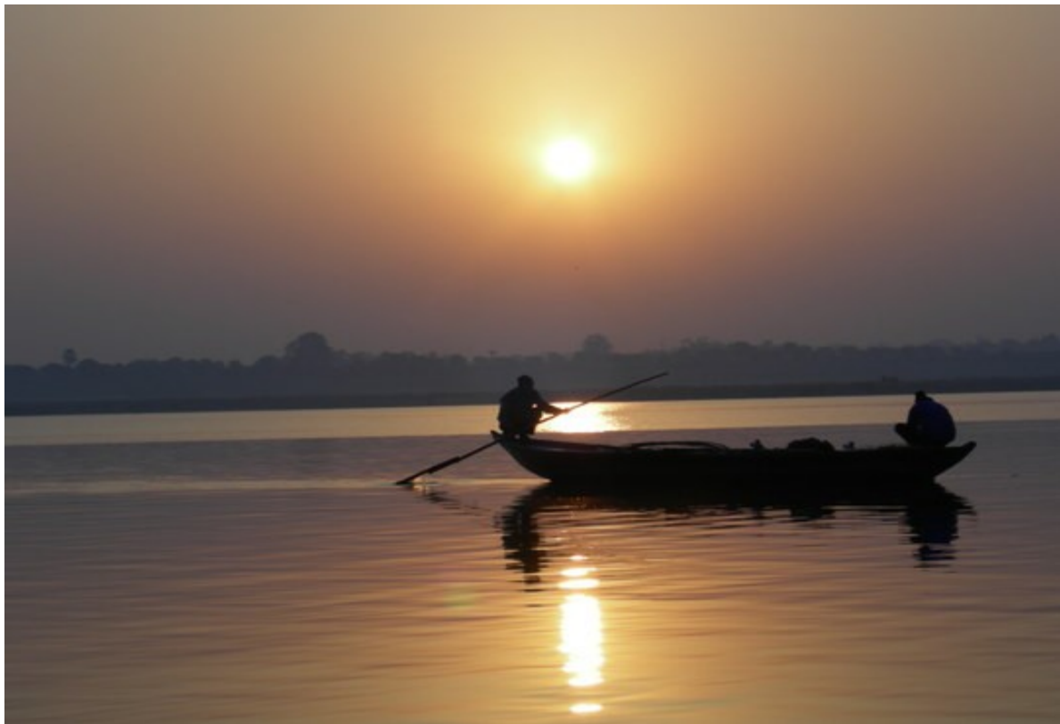
Il nostro risveglio al mattino: alba sul Gange

siamo appena rientrati: ancora le giornate ci sembrano scandite dai ritmi indiani; continua a risuonare l'eco delle voci dei bambini e sempre vivide sono le immagini dei momenti lì intensamente trascorsi e delle esperienze vissute. Di seguito le prime foto da condividere assieme a voi di alcuni momenti della vita al Bal Ashram, in particolare al mattino: