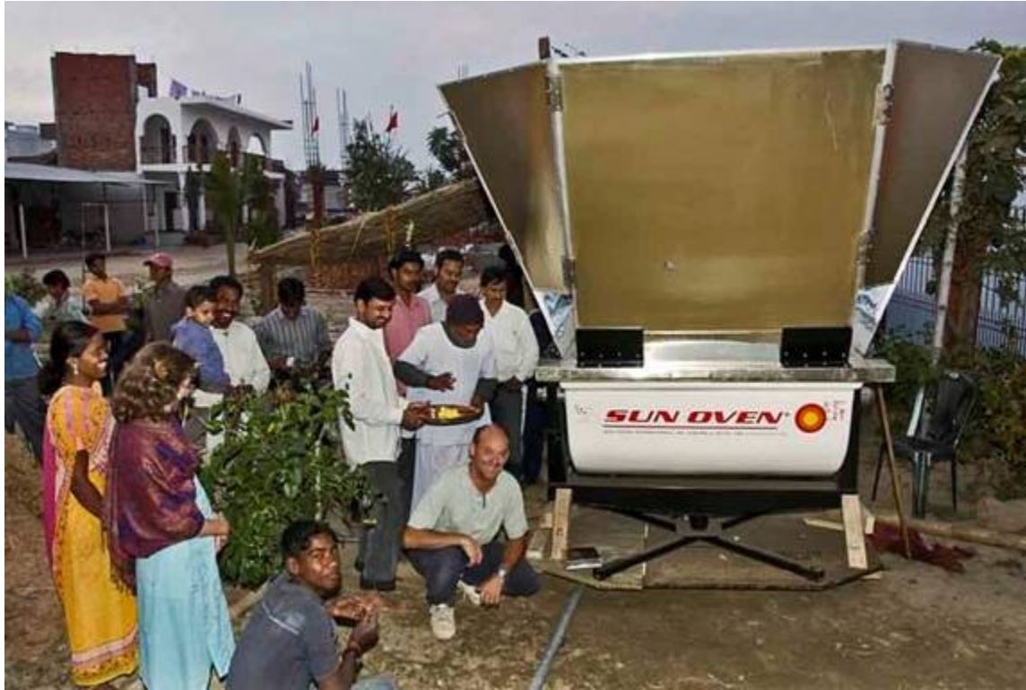
Tutti insieme per l'installazione del forno e per una semplice puja di buon auspicio