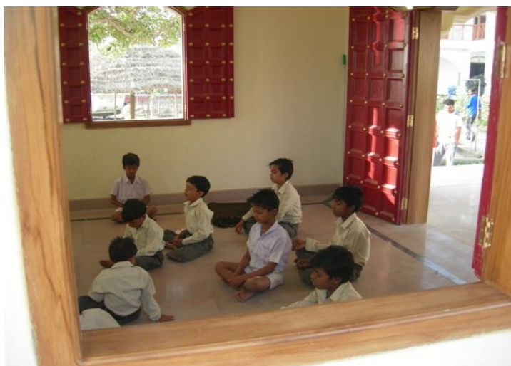
I bhajan insieme al mattino nel nuovo tempio prima di andare a scuola