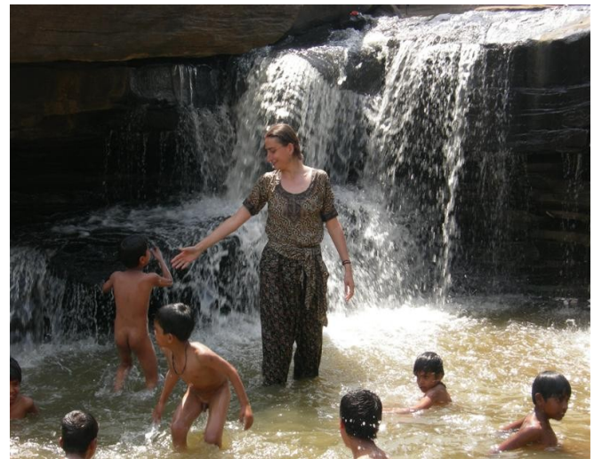
.....cascate: impossibile resistere ad un bagno; in pochi secondi via i vestiti e tutti a mollo compresi noi!.....